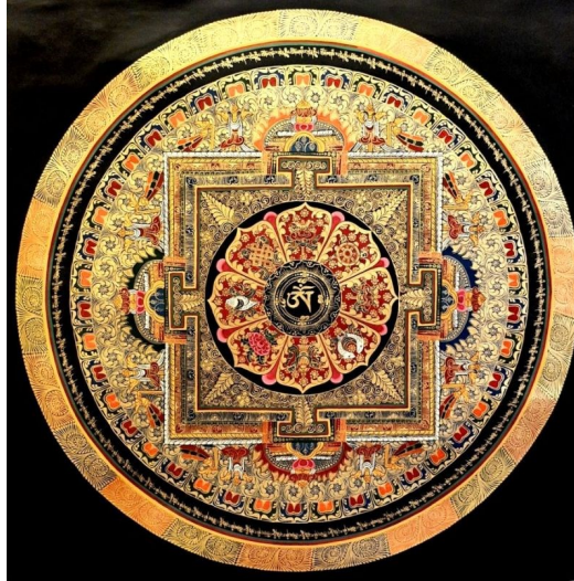
Tibetisches Mandala mit den acht Symbolen für Glück und Heilung

13.—18. Oktober 2024 im Lindenhof im Schwarzwald (D)